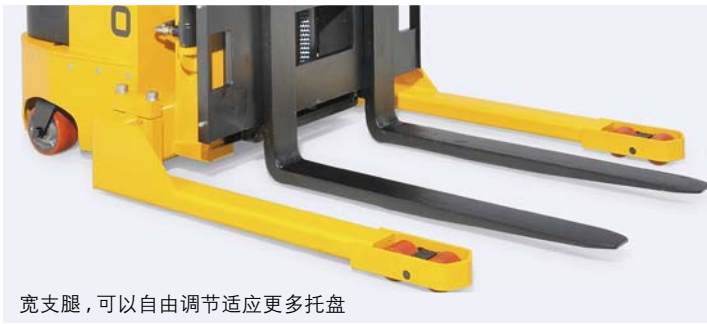
宽支腿，可以自由调节适应更多托盘