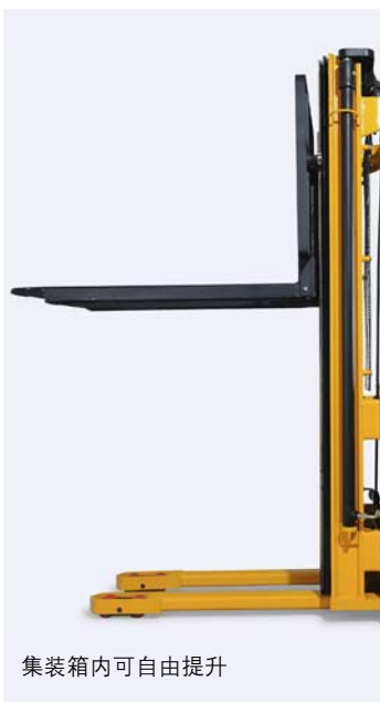
集装箱内可自由提升